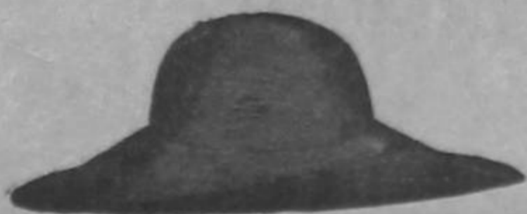
Forma desde ₡ 4.50