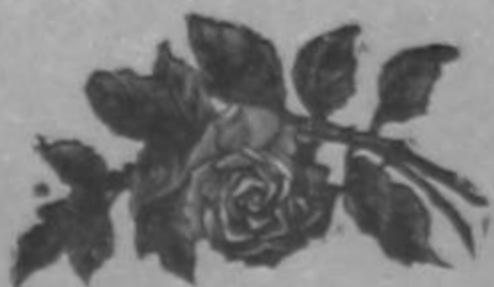
Plumas fantasía desde ₡ 1.00