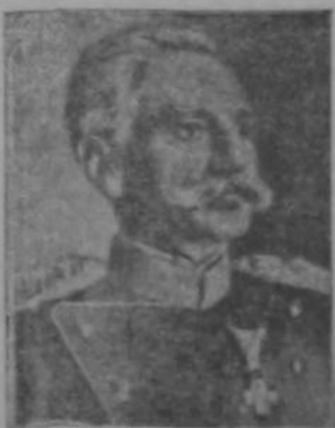
Rey de Servia

De esa gran matanza son responsables las naciones signatarias del Tratado de Berlín firma-