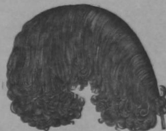
Plumas lloronas desde ₡ 6.00