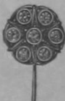
Ramos de Rosas desde ₡ 1.00