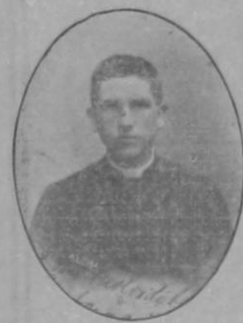
PBRO. JORGE VOLIO

La llegada del Presbítero don Jorge Volio a Heredia fué un nuevo triunfo. Más de quinientas personas le esperaban en la estación del ferrocarril. Mucho antes de la llegada del tren que le conducía, los vitores llenaban el aire.