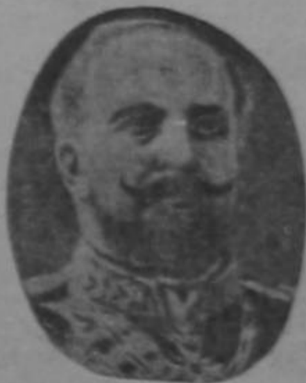
Rey de Montenegro

Austria posee solamente dos puertos de importancia, Trieste y Fiume, insuficientes para defender sus escuadras mientras Italia mantenga una armada superior en aguas del Adriático; motivo por el cual tiene sus ojos puestos sobre Salónica, en Macedonia.