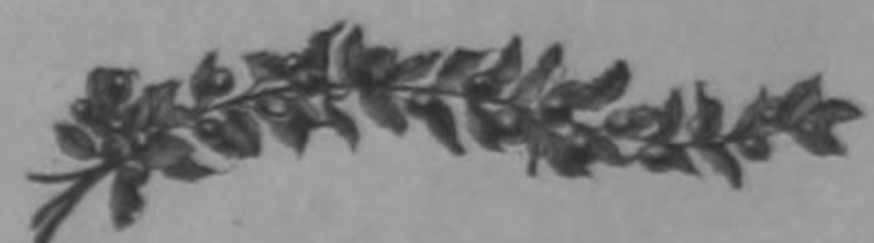
Coronas de flores surtidas desde ₡ 0.75

Por lo tanto está avisado que quien desea comprar estos artículos de la última novedad á precios razonables debe acudir á los